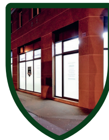
ACCÈS AUX LOCAUX de 6 h à 23 h, 7 j/7