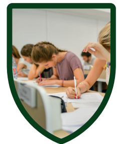
PLACES NOMINATIVES + casiers individuels